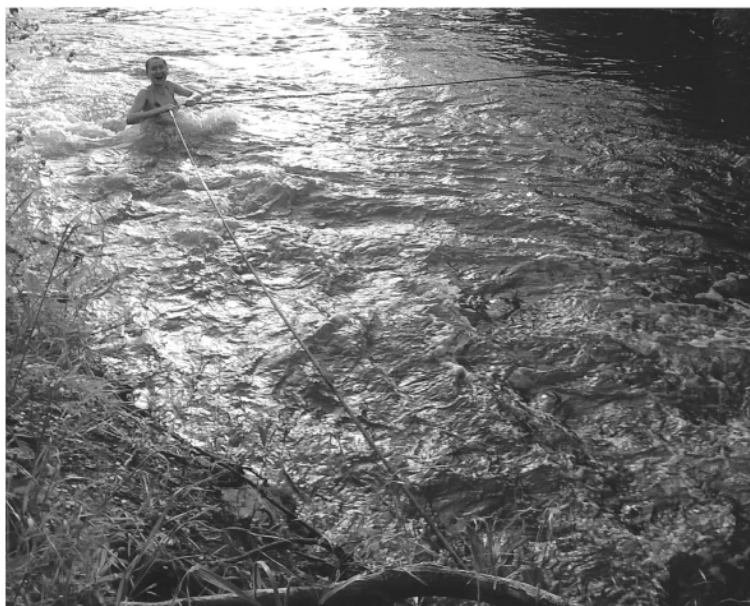
● Гидромассаж на реке Кундрючьей

Вообще в Ростовской области сложно найти район, где не было бы условий для отдыха на природе. Холмы и горы, скалы и озера, и конечно, тихий Дон с его притоками – все это есть хоть Усть-Донецком, хоть в Орловском районе. В Каменском районе, что ближе к северу области, можно открыть для себя Северский Донец. Многочисленные базы готовы